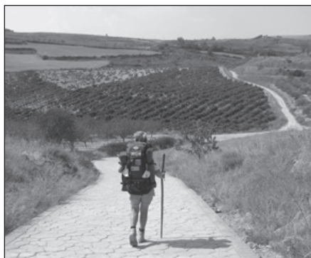
Wijnvelden van de Rioja

Inmiddels zijn dan de laatste 14 dagen van onze reis aangebroken. We denken steeds vaker aan thuis en aan de hereniging met de kinderen, maar eerst gaan we nog genieten van onze loopdagen. De eerste valt ons zwaar, de weg is lang en prettige stopplaatsen zijn er nauwelijks. In een dorp worden we verwezen naar een café iets buiten de route. Dat blijkt gesloten te zijn. We lopen terug het dorp in en gaan binnen bij een refugio waar we eerder iemand zagen. In het halletje eten we een broodje en