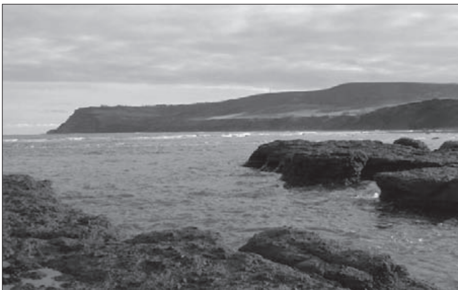
De rotsige kust bij Ravenscar

Of nu de ±175 km lange tocht of de 22 km van vandaag ons parten speelt weten we niet. Maar wat wij wel weten is, dat het voor vandaag echt genoeg ge-