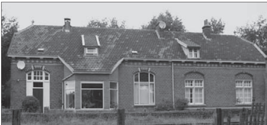
Station Liempde aan het 'Duits lijntje'.