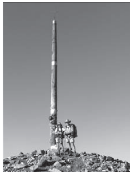
Op een hoogte van 1504 meter Cruz de Ferro. Ons 'steentje' maakt deel uit van deze stapel.

Maar eerst beklimmen we nog een berg, de Cruz de Ferro van 1504 meter hoog. Daar staat een gigantisch ijzeren kruis waar iedere pelgrim zijn of haar steentje achterlaat. De steen, die je van thuis meeneemt, staat symbool voor alle lasten die je met je meedraagt en