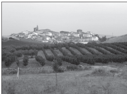
Uitzicht op Cirauque, we moeten nog veel klimmen voordat we daar zijn.

Dan komt de dag dat we weer een berg moeten beklimmen. We kiezen voor de 'Camino duro' i.p.v. de makkelijke weg langs de autobaan. Dat houdt in dat we