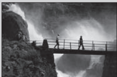
De Preikestole 20