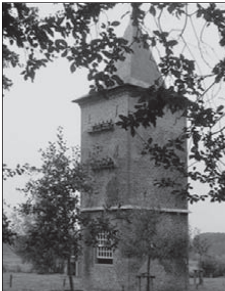
Toren bij Kasteren.

Binnenkort worden de door Theo en Marinus beschreven routes nagelopen door vrijwilligers die de omgeving niet