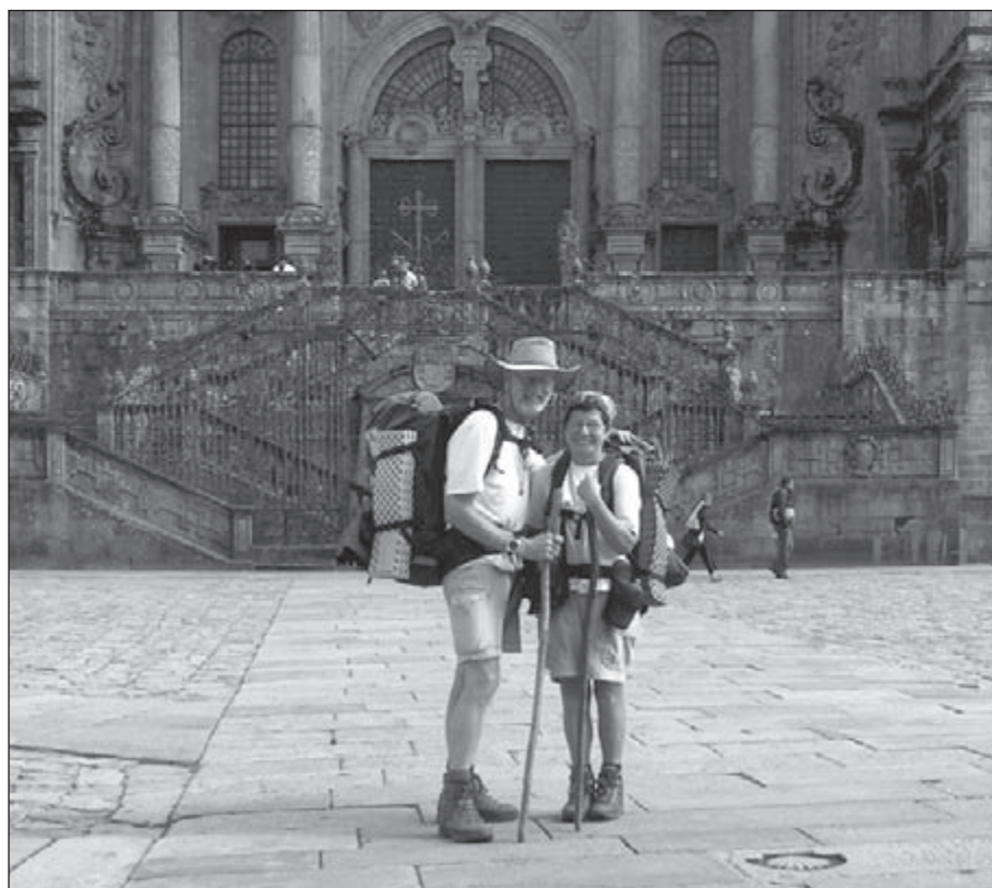
4 Oktober 2006 14.30 uur. Na bijna 3000 km aangekomen in Santiago! Blij, gelukkig, voldaan, moe en een beetje spijt dat het nu voorbij is.