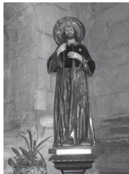
Een mooie afbeelding van St. Jacobus in Logroño.

De volgende dagen lopen we echt over heel veel natuurpaden, regelmatig klimmen en dalen over de heuvels hoort er ook bij en de uitzichten zijn heel erg mooi. Zo komen we elke dag iets dichterbij ons einddoel, Santiago!