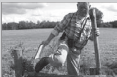
Rooise rondwandeling 14-15