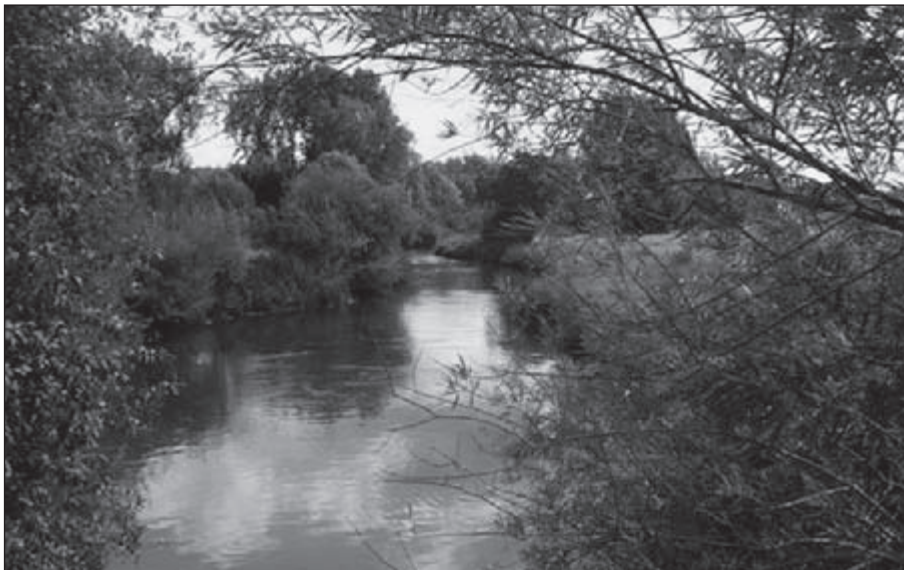
Olland aan de Dommel.

Van het één komt dikwijls het ander. Dat blijkt maar weer in onze bakermat Sint-Oedenrode, waar twee jaar geleden gestart werd met de zogeheten Rooise wandelingen. Een idee van de gemeente, die vooral ouderen wat meer in beweging wilde krijgen. OLAT kon die handschoenen natuurlijk niet laten liggen en zo ontwikkelden Marinus van Roosmalen en zijn jongere broer Theo van de Ven wekelijks nieuwe wandelroutes van 10 en 7 kilometer door het uitgestrekte buitengebied; steeds vanuit een ander kerkdorp. Toen ze er een heleboel hadden, begon het te kriebelen. Want al die kortere stukjes kun je natuurlijk ook samensmeden tot iets bijzonders, en dat is precies wat Theo en Marinus de afgelopen maanden hebben gedaan.