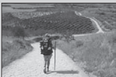
Op weg naar Santiago 22-23

Blote armen in Borkel: een winterserietocht met bijna zomerse temperaturen!